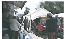
Populärt!

SVEG Handels dag i Sveg förknippas med rulltårtskalas. Sedan många år tillbaka har handlarna i centrum bakat och bjudit på rulltårta och det här året var inget undantag.