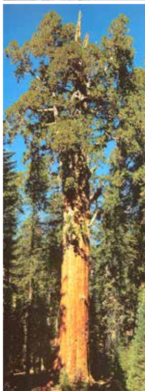
General Sherman – världens största nu levande träd.