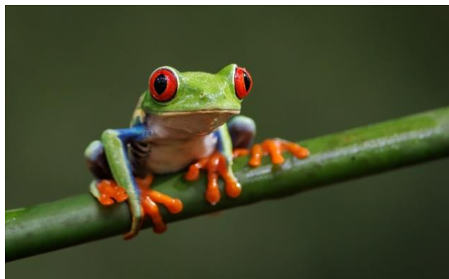
Rödögd lövgroda i Costa Rica

Costa Rica har flera aktiva vulkaner och idag ska vi besöka nationalparken Rincon de la Vieja där vulkanen med samma namn ligger och just nu är den mest aktiva vulkanen i landet. De aktiva markerna runt vulkanen har ett överflöd av naturliga attraktioner som varma källor och gejsrar. Det är ett litet äventyr för dig som letar efter upplevelser i exotiska miljöer. Att besöka aktiva vulkaner är alltid imponerande och vi tillbringar dagen i nationalparken.