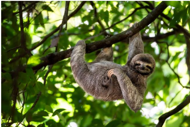
Lättja i Costa Rica

Idag kör vi till bergsstaderna Santa Cruz i Turrialba där vi ska besöka Finca Blanco & Negro, en imponerande liten gård som drivs av två charmiga systrar. Här ska vi på en så kallad «Farm to Table»-resa där vi kommer att serveras en fantastisk lunch med spännande råvaror från deras ekologiska paradis. Antar att det kommer både nya smaker och inspiration till din egen matlagning efter detta besök. Efter lunch kör vi till byn Aquiares. Här välkomnas vi som hedersgäster i huvudbyggnaden på en hacienda, där nyrostat kaffe väntar. Costa Rica är världskänt för sitt kvalitetskaffe och vi tas med på en resa in i kaffevärlden där vi lär oss allt från odlingens historia och kvalitetssäkring till det som populärt kallas «Grano de Oro» (guldkorn). Dagen avslutas med en så kallad «coffee cupping», som är en kaffeprovning där man jämför ett antal färdiga koppar kaffe, för att kunna peka ut smakegenskaperna hos de olika. Kaffeplantagen ligger otroligt bra till med flera vattenfall och utsikt över berg och skogar. Det här är i hög grad en kulturell dag.