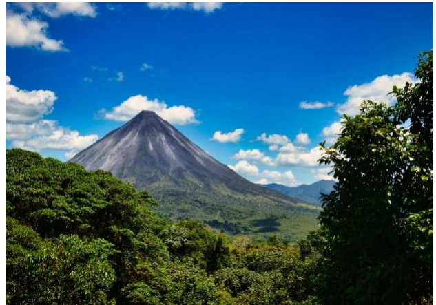
Arenal-vulkanen i Costa Rica