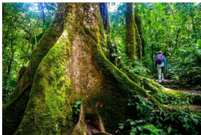
Urskog i Costa Rica