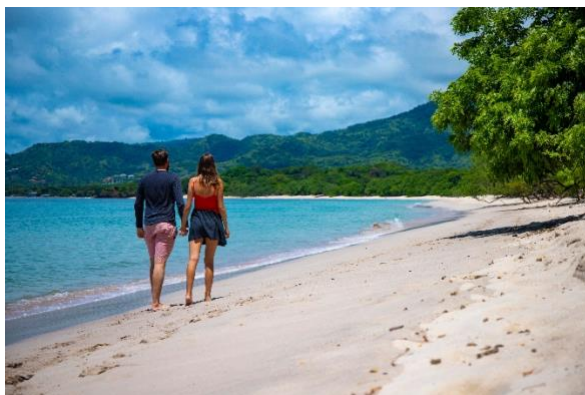
Strand og regnskog i Costa Rica