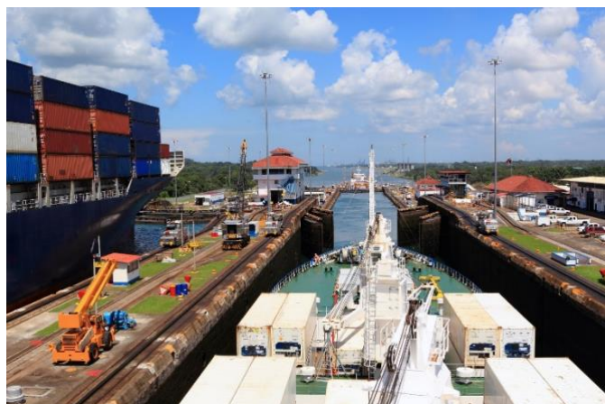
Panama-kanalen från Stilla havet til Karibien

Efter frukost på hotellet blir vi upphämtade och körda till Miraflores-slussarna, som är den del av den imponerande Panamakanalen som är öppen för besökare och turister. Här får vi en inblick i historien, ingenjörskonsten och hur otroligt viktig Panamakanalen är, och har varit för Panama. Efter lunch kör vi till Casco Viejo och den vackra gamla staden Panama City för en guddad vandring. Det kommer också att finnas tid att vandra runt på egen hand innan vi återvänder med buss till hotellet.