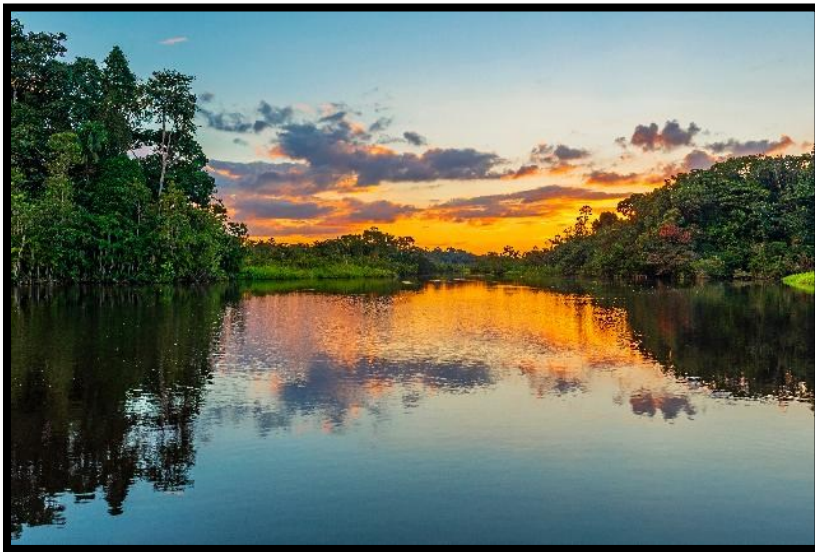
Puerto Maldonado ligger vid floden Madre de Dios, som är en del av Amazonas-systemet.

Hela dagen tillbringas i regnskogen med en rad spännande aktiviteter att välja mellan. Programmet kan inkludera utflykt till den vackra sjön Lago Sandoval, safari för att observera fåglar, jätteuttrar och kajmaner, besök i en apkoloni samt guidning i djungelns «apotek». Här får vi lära oss hur modern medicin hämtat inspiration från ursprungsbefolkningens månghundraåriga gamla kunskap om naturens läkande växter. Observera: Alla aktiviteter är noggrant planerade och helt säkra, utan risk för liv och hälsa. Regnskogen går egentligen inte att beskriva – den måste upplevas! (Måltider inkluderade: Frukost / Lunch / Middag)