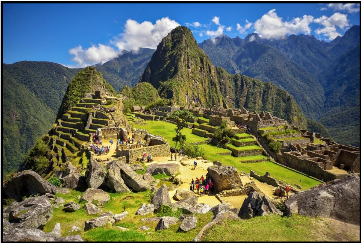
Machu Picchu ligger djupt inne i Anderna där bergskedjan möter Amazonasskogen.

familj ger oss ett intryck av vardagslivet så som urfolken har levt det genom många hundra år. I dag är lunchen inkluderad och på eftermiddagen tar vi tåget till Aguas Calientes. Järnvägen följer floden och går ner nästan tusen höjdmeter innan vi anländer till stationsstaden som ligger 400 meter nedanför själva Machu Picchu. Här forsar Vilcanota-floden genom staden som ligger inklämd mellan branta bergssidor med frodig vegetation. Vi checkar in på Hotel El Mapi mitt i byns huvudgata och gör oss redo för kvällens middag som också är inkluderad. (Måltider inkluderade: Frukost / Lunch / Middag)