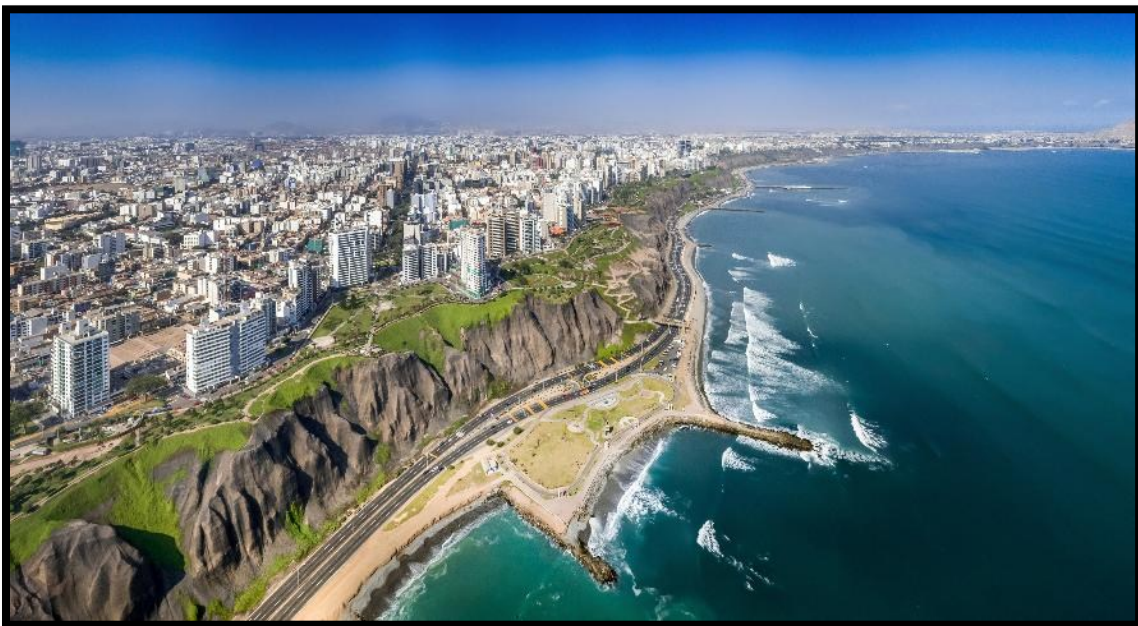
Perus huvudstad Lima ligger precis vid Stilla havet och är en kosmopolitisk stad med över 10 miljoner invånare.

huvudbassängerna i Titicacasjön. Här transporteras fordonen över med små färjor, medan vi som passagerare går ombord på egna båtar. Copacabana är ett viktigt pilgrimsmål i Bolivia och har fått sitt namn från den lokala jungfru Maria-figuren Virgen de Copacabana, som senare gav namn åt den världsberömda stranden med samma namn i Rio de Janeiro. Vid ankomst checkar vi in på Hotel Rosario Lago Titicaca, vackert beläget vid sjöns strand. Här blir det gemensam middag och övernattnig i vackra omgivningar. (Måltider inkluderade: Frukost / Lunch / Middag)