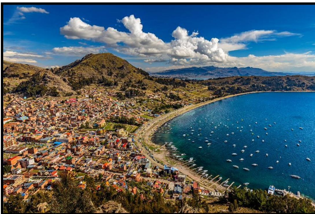
Den lilla staden Copacabana ligger vackert belägen vid Titicacasjöns strand på den bolivianska sidan. Den berömda Copacabana-stranden i Rio de Janeiro har fått sitt namn härifrån.

högslätten Altiplano, ett storslaget landskap präglat av öppna vidder, lamor och snötäckta bergstoppar i horisonten. Kontrasterna är stora när vi närmar oss La Paz. Plötsligt uppenbarar sig staden i en dramatisk dalsänka, omgiven av berg på alla sidor – en av världens högst belägna huvudstäder. Vid ankomst tar vi linbanan, Mi Teleférico, ner i staden (självklart frivilligt). De moderna gondolerna ger en spektakulär utsikt över La Paz och en god överblick över stadens unika geografi. La Paz är byggd i en djup dal, där de rikare stadsdelarna ligger lägre och de mer folkrika områdena klättrar uppför dalsidorna mot högslätten El Alto. Staden är en fascinerande blandning av urbefolkningens traditioner, kolonialt arv och pulserande storstadsliv – färgrik, kaotisk och full av liv. Vi checkar in och övernattar på Hotel Presidente. (Måltider inkluderade: Frukost / Lunch)