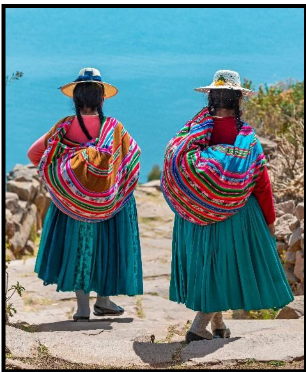
Två kvinnor från ursprungsbefolkningen på ön Taquile

människor. Här talar de det lokala språket quechua som var huvudspråket i Inkariket. Ön är 5,5 × 1,6 km stor. Tiden har stått stilla här ute och människor lever och bor som de har gjort i flera hundra år tillbaka i tiden. De är gästfria och tillmötesgående och vill gärna sälja oss sina hantverksprodukter som kvinnorna väver och männen stickar. Slöjdprodukterna på Taquile är kända för att hålla hög kvalitet. Politiskt är denna ö som en oas i ett annars partipolitiskt virrvarr i dagens Peru. Här lever man i ett kommunalt kollektiv där man samarbetar om att odla jorden, bestämma vem som ska odla vad, hur många får och kor man ska ha osv. Sedan fördelar man produkterna efter hur många munnar som ska mättas i den enskilda familjen. När solen skiner på Taquile och himlen speglar sig i sjön är utsikten i världsklass! Och när vi äter lunch hos en lokal familj – som regel kan vi välja mellan öring eller omelett – och ser ut över sjön och andas in den fridfulla atmosfären, tänker man att detta är ögonblick som knappast kan värderas högt nog. På eftermiddagen tar båten oss tillbaka till Puno och vårt härliga hotell vid sjöns strand. (Måltider inkluderade: Frukost / Lunch)