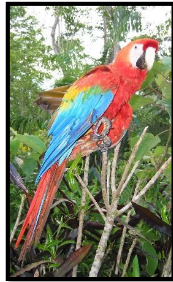
Ara papegoja i Amazonas.