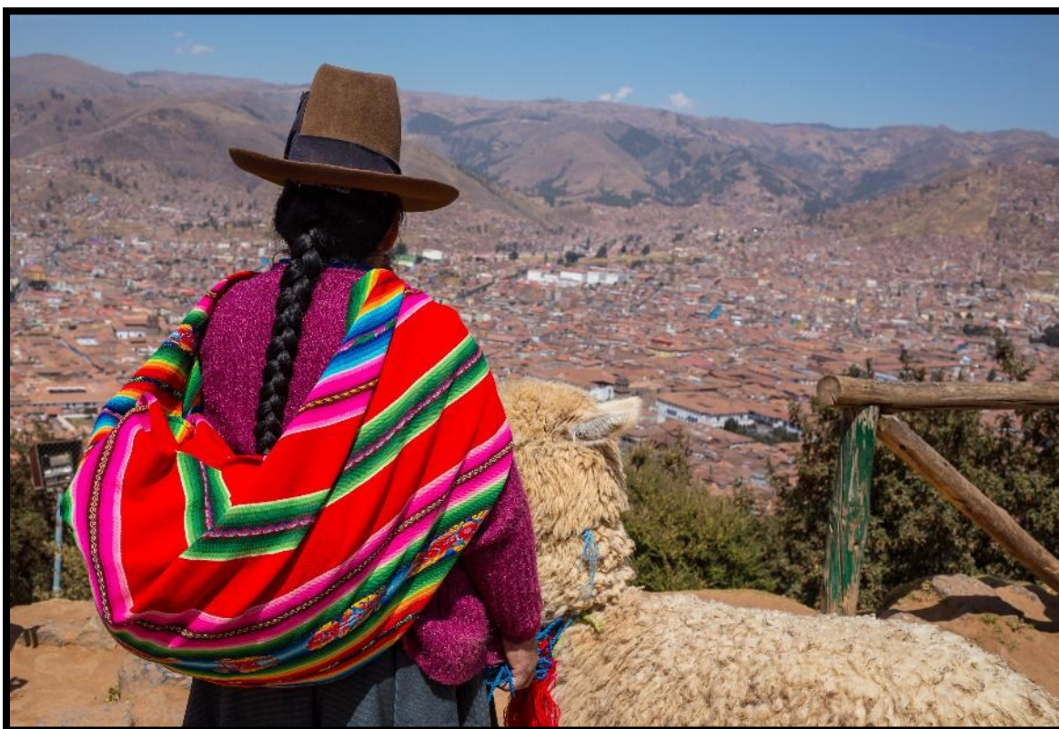
Utsikt över staden Cusco, sedd från Sachayshuamán på kullen ovanför staden.

till stationsstaden. Här blir det välförtjänt lunch innan resan går med tåg och buss till Inkarikets huvudstad Cusco där vi ska bo tre nätter på Hotel José Antonio Cusco. (Måltider inkluderade: Frukost / Lunch)