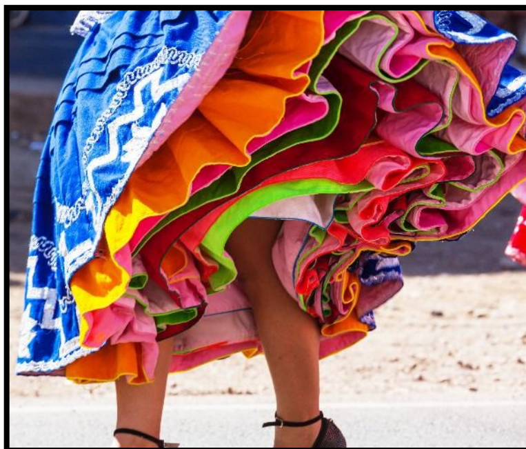
Peru är färger, fester och människor!

Vi träffade den här pojken djupt inne i Anderna.