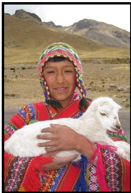
Välkommen till Peru!

Resan går via Amsterdam med KLM. Vi flyger från Arlanda/Landvetter/Kastrup tidigt på morgonen och anländer till Perus huvudstad Lima på eftermiddagen kl. 18.10 lokal tid. Från flygplatsen går buss till Hotel Holiday Inn som ligger nära flygplatsen. Hotellets restaurang är öppen till kl. 23.00 för dem som önskar något att äta innan vila. Med sex timmars tidsskillnad och en lång flygresa bakom oss är det skönt att komma i säng tidigt. (Måltider inkluderade: Mat på flyget)