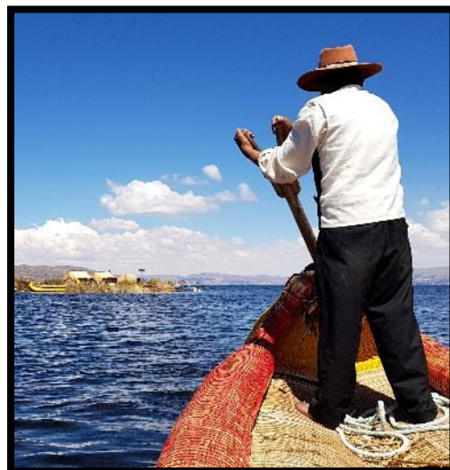
Titicacasjön ligger på Altiplano-platån i höglandet och är hemvist för Urosfolket som bor här ute.