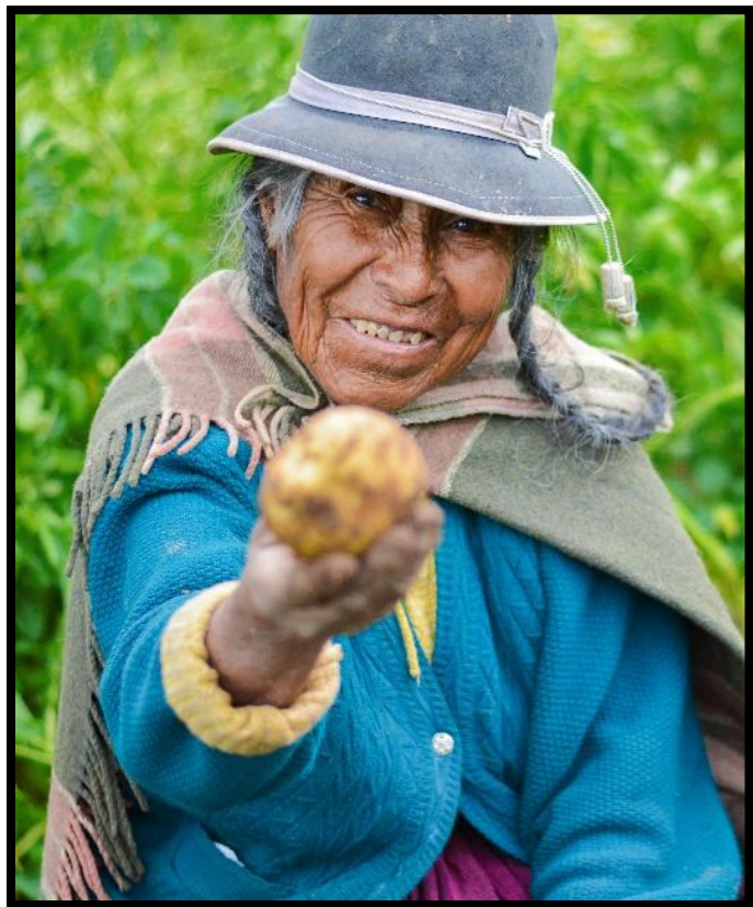
Möten med ursprungsbefolkningen i Anderna